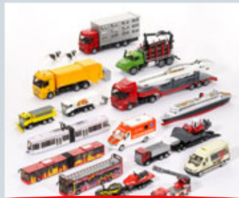
Super Set 1