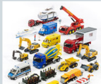
Super Set 2